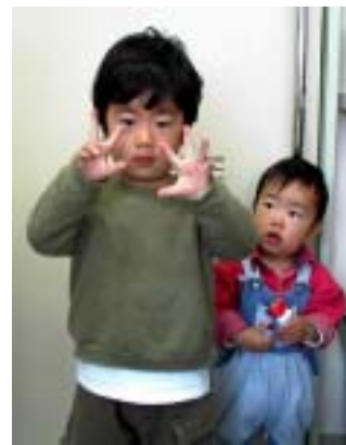
今月の顔 お兄ちゃん、かっこいい！！

連載！赤ちゃんの処置 鼻づまり 赤ちゃんの鼻の穴は小さく、ちょっとした刺激で鼻汁がでます。必ずしも風邪をひいているわけではなく、まずは家庭内処置をしてあげてください。 家庭内処置 加湿する スポイトで吸い取る 風呂はよい(湯気が鼻汁を柔らかくする) 診察必要 風量は減った 熱がでた ゼイゼイしてる 機嫌悪く寝ない、など