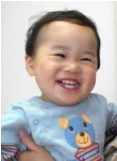
今月の顔 剛人くんとってもいい顔

5月7日(火)、5月21日(火)、6月4日(火)は 午後から大学診察のため時間外対応できません 5月22日(水)は保健所勤務のため時間外対応できません